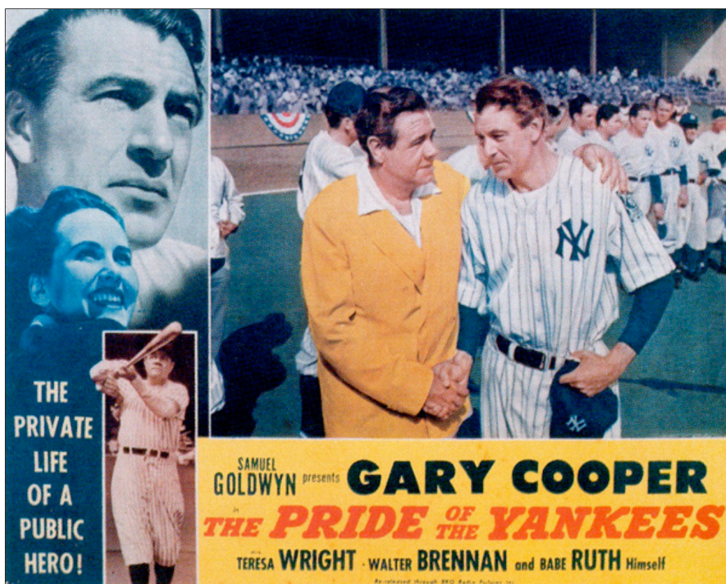
Lobby card för The Pride of the Yankees

Lou är en snäll och varmhjärtad son som gärna vill vara modern till lags, och därför börjar han studera på Columbia. Där gör han sig känd som en god baseballspelare i skollaget, och blir invald i studentföreningen där hans mor sköter köket. Det finns emellertid också de som försöker förlöjliga hans blyga bortkommenhet. När en ondsint föreningskamrat ordnar ett elakt spratt för honom i samband med en skolbal brister det för Lou, som står upp för sin stolthet och sitt egenvärde genom att slå ner honom. Lou är nu på väg att bli en man och en självständig individ, som inte låter någon sätta sig på honom.