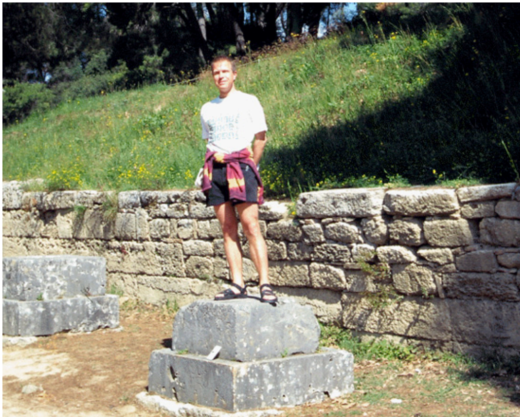
En osportslig recensent uppställd som Zanesstaty som varning och varnagel framför ingången till Stadion i Olympia för dem som funderat på att fuska.