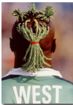
Nigerianen Taribo West (AJ Auxerre, Inter Milan, A.C. Milan, Derby County, FC Kaiserslautern, FK Partizan, Al-Arabi, Bolton Wanderers, Plymouth Argyle och nigerianska landslaget) tyckte att grönt hår var kul och moderiktigt. (Ur Footballer's Haircuts )