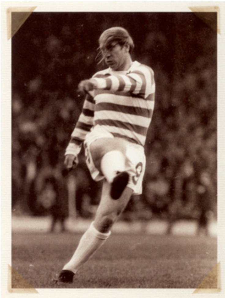
Charlton var berömd för två saker, sin fruktansvärda sparkstyrka, och sitt hämthår, som bara vägrade att ligga kvar i matchens hetta. (Ur Footballer's Haircuts)

Bobby Charlton, brukar man säga, var känd för två saker – det fruktade skottet och den över flinten överkammade luggen vilken vägrade att hålla sig på plats ute på plan. Sir Bobby, som han också kallas, var det engelska landslagets och Manchester Uniteds härförare i slutet av sextio- och början av sjuttioalet. Stenhård i kroppen som han var och med en balans som gav intryck av att han hade litet för korta ben, vände han bort motspelare och manade fram lagkamrater som George Best till matchavgöranden efter matchavgöranden. "Lappen" på huvudet kunde han inte rå på, den levde ett eget liv. Om någon fotbollsspelare personifierar det så kallade "hämthåret" så är det Bobby Charlton. Denna frisyr förknippar vi med spelaren Bobby Charlton, i likhet med de fotbollsmässiga förmågor han i övrigt besatt. Vi förknippar den mer med spelaren än med människan Bobby Charlton, människan utanför fotbollen. Vad vet vi om honom egentligen?