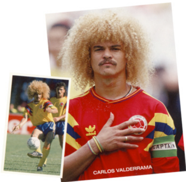
Fotbolls- och frisyrikonen Carlos Valderrama bytte i sin sista match (1998) tröja med David Beckham, som väl får sägas ha förvaltat alla aspekter av det arvet på bästa möjliga sätt. (Ur Footballers' Haircuts)