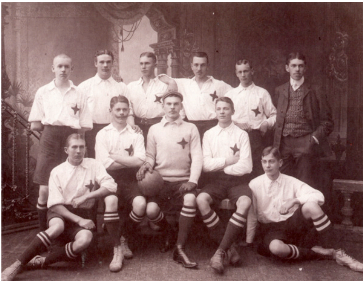
IFK Norrköping, borgerskapets lag i Norrköping (medan Sleipner var arbetarklassens fotbollslag). Också här tycks frisyreerna tala: "Vi vill vara prydliga". (Ur Fotbollsfrisyrer )