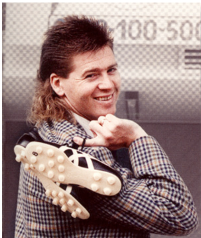
Chris Waddle låg på Englandslistans tolfte plats 1987 tillsammans med Glenn Hoddle. Artistnamnet var Glenn & Chris (snarare än Hoddle & Waddle!) och låten var naturligtvis "Diamond Lights". (Ur Footballer's Haircuts )

hänseende. Visserligen fanns det ett antal spelare vars identitet och agerande på plan inte hade varit desamma utan deras frisyrer. Charltons lagkamrat George Best, ”den femte Beatles-medlemmen”, exempelvis, hela hans leverne på och utanför fotbollsplanen konkretiserades i och genom hans frisyr. Om man idag tittar tillbaka på historien kan man emellertid utan svårighet föreställa sig fotbollsfrisyrns betydelse som sådan, för publiken, för åskådaren, för det samhälleliga ögat. Och – för spelarna själva.