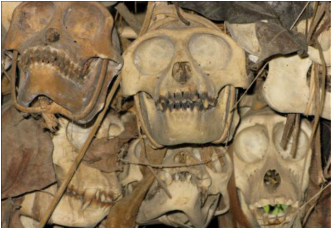
Abetrofær i langhuset er en anden objektivisering end et skudt kokosnød og et sportsresultat.

Sportens ”objektivitet” – som hele konfiguration af rum, tid og energi, relationer og objektivisering – er altså kulturelt relativ. Den er ikke universel, som den olympiske sports filosoffer fortæller.