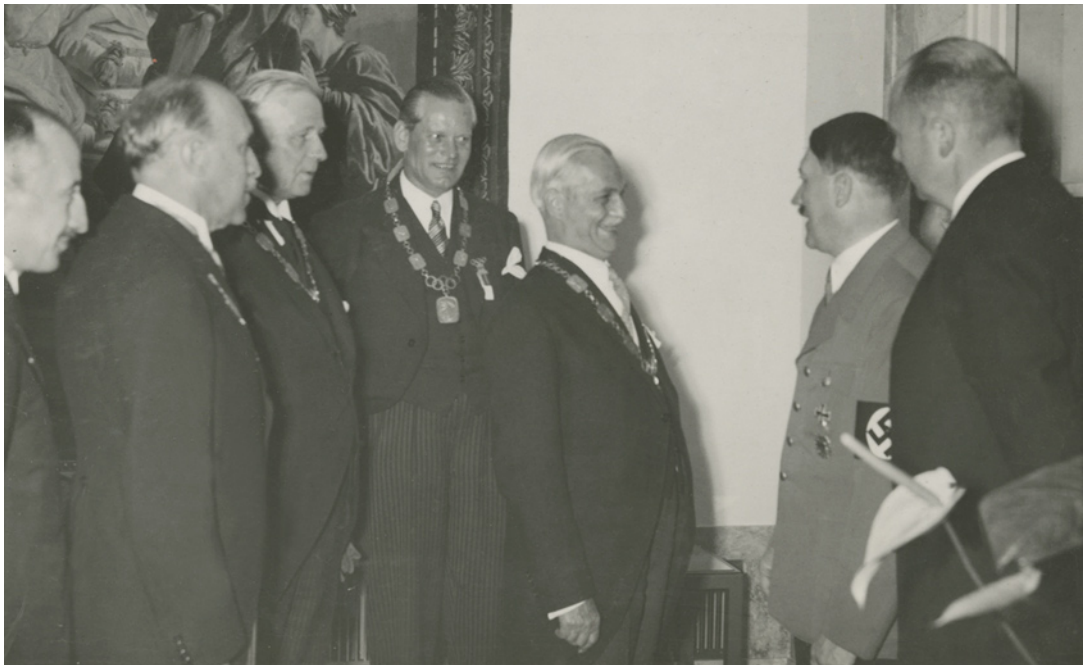
En nöjd J. Sigfrid Edström träffar Reichskanzler Adolf Hitler, i samband med Berlin-OS 1936.

IOK var således redan 1933, tre år före OS, oroligt för de judiska idrottarnas behandling i Tyskland och deras möjlighet att delta i Berlin. Det som kom att präglade den fortsatta debatten var de garantier som tyskarna gett på mötet i Wien. IOK, och inte minst Edström, valde att tro på och hänvisade ideligen till dessa garantier och därmed fanns det ingen återvändo. Wien-mötet är således centralt för att förstå både IOK:s och Edströms agerande.