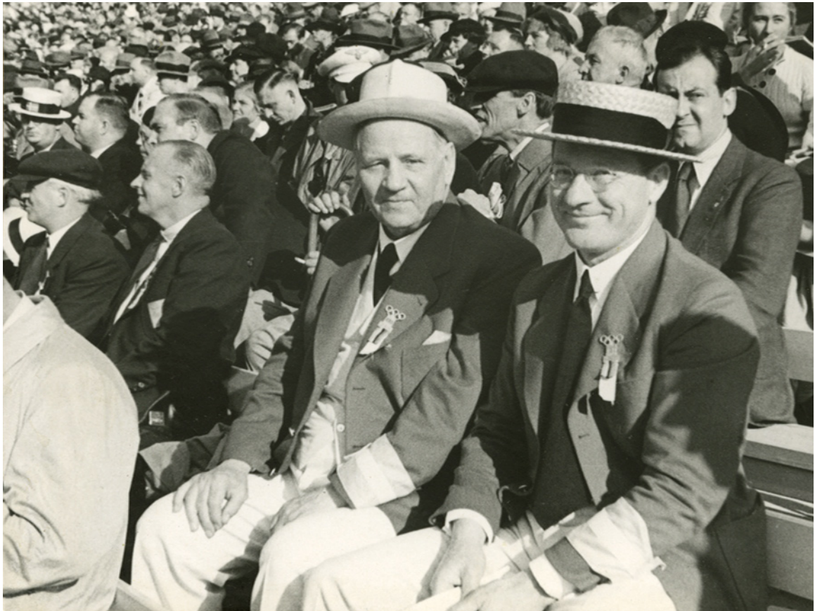
J. Sigfrid Edström bland publiken på Berlin-OS 1936, och vid hans sida den pålitlige nazivännen och IOK-kollegan Avery Brundage. Notera deras backstage pass på kavajslaget.

Hans von Tschammer und Osten, a brutal regional leader in the Brown Shirts, better known as the SA..., whose storm troopers had killed several workers' sportsmen and children, was made responsible for all sports in the newly created office of Reichsportführer. 35